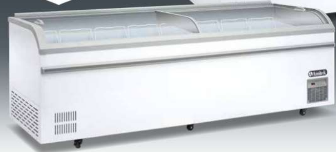
DUAL COMPRESSOR C AX1000DF